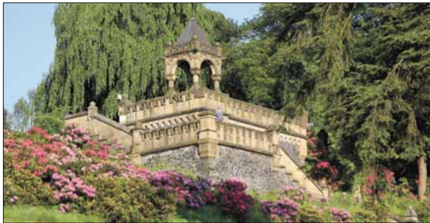
Die wunderschöne Dicke-Ibach-Treppe im Ringeltal zur Zeit der Rhododendronblüte.

Einen weiteren touristischen und naturbewahrenden Aspekt hat eine Mitgliedschaft im Europäischen Gartennetzwerk (EGHN). Einer Initiative von Dirk Fischer folgend haben die Stadt Wuppertal für die Hardt mit dem Botanischen Garten und für den Zoologischen Garten sowie der Barmer Verschönerungsverein für seine Barmer Anlagen die Mitgliedschaft beantragt und dürfen sich auf Besuche aus anderen Regionen und Ländern