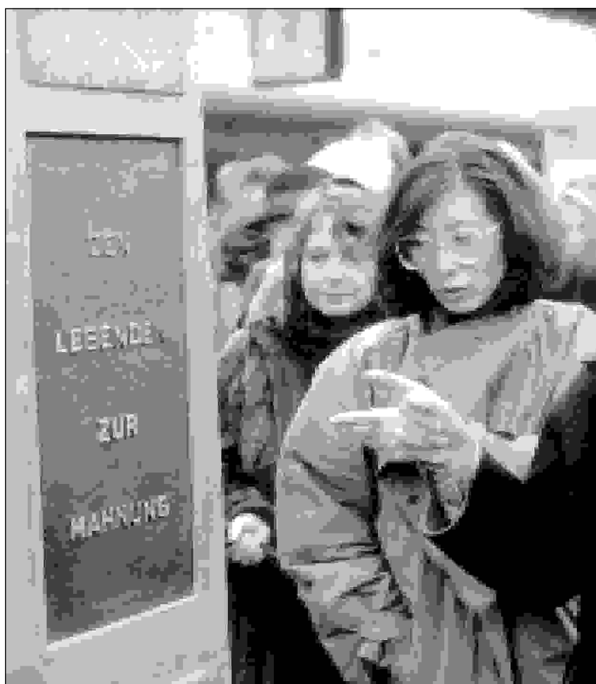
Kulturausschuss wollte kein Zeichen setzen.

Wesentliche Punkte der aktiven Auseinandersetzung mit dem Nationalsozialismus sind schonungslose Offenheit bei der Aufarbeitung der NS-Zeit und eine stetige Erinnerungsarbeit. Diesen Zielen hat sich der „Verein zur Erforschung der sozialen Bewegungen im Wuppertal e.V.“ verschrieben. In der Reihe „Verfolgung und Widerstand in Wuppertal“ wird im Dezember bereits Band drei publiziert, eine bearbeitete deutsche Übersetzung der Erinnerungen des Antifaschisten Helmut Kirschey, der 1913 in Elberfeld geboren wurde und heute in Schweden lebt. Unter dem Titel „Helmut Kirschey – ein Antifaschist minnen (Erinnerungen eines Antifaschisten)“ erschien das Buch 1997 in Stockholm und stieß in Schweden auf große Resonanz. Helmut Kirschey erhielt dafür im letzten Jahr den Kulturpreis eines Arbeiter-Bildungsverbandes. In dem Buch wird die Kindheit und Jugend von Kirschey in Wuppertal ausführlich geschildert. Zur Finanzierung der geplanten Publikation ist der Verein auf Unterstützung angewiesen.