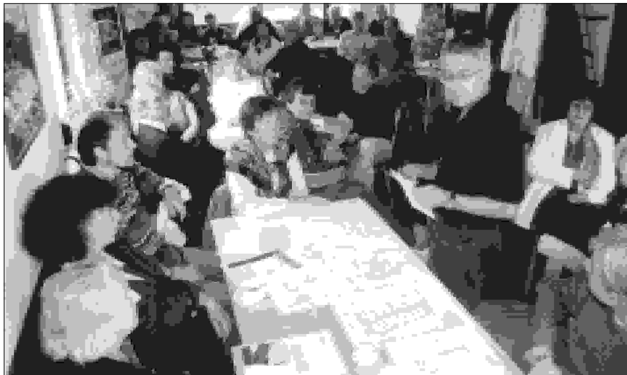
GRÜNE laden zum Ortstermin – im Naturfreundehaus werden alle Argumente gegen die Bebauung der Luhnsfelder Höhe ausgetauscht.

Wenn ein sogenannter Vorhabensträger am 12.04.2000 einen Antrag auf Einleitung eines vorhabenbezogenen Bebauungsplanes Luhnsfelder Höhe stellt und der Rat dann bereits im Juni darüber befindet und mehrheitlich positiv beschließt; was steckt dahinter? Wenn dann weiter die Vorlage der Verwaltung die Beschreibung des Vorha-