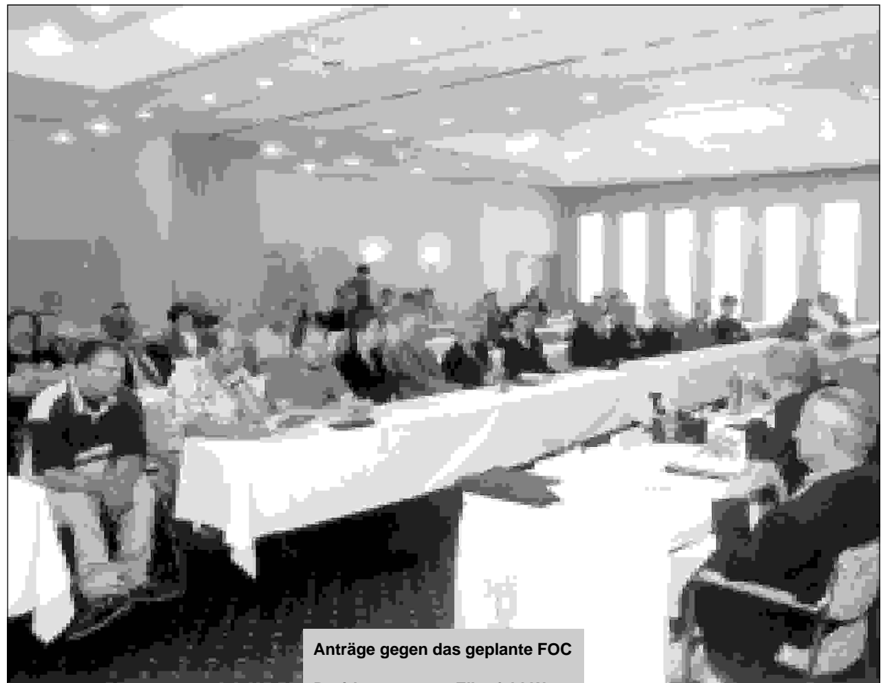
Veranstaltung der GRÜNEN – ein voller

Aus diesen Gründen sind Bündnis 90/Die GRÜNEN entschiedene Gegner der FOC-Pläne der Stadt. Um dem breiten Protest vieler BürgerInnen und ge-