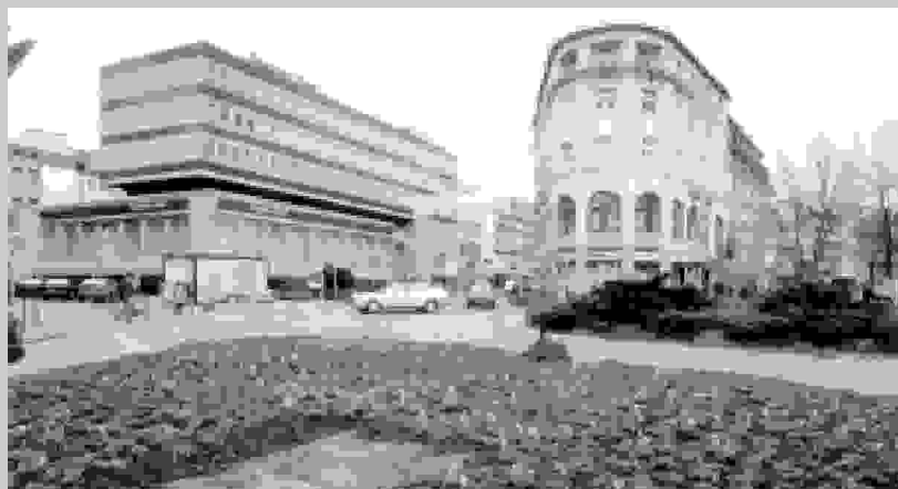
„Aufräumen“ im Verkehrsausschuss

Überall auf der Welt werden Ampeln durch Kreisverkehre ersetzt - überall, nur nicht in Elberfeld. Am Kasinokreisel soll ein nicht vorhandenes Problem mit einem Kreuzungsumbau und einer Ampelanlage gelöst werden. Die CDU will jetzt um jeden Preis ihr abstruses 49-Punkte-Programm umsetzen und Wuppertal zur autogerechten Stadt machen.