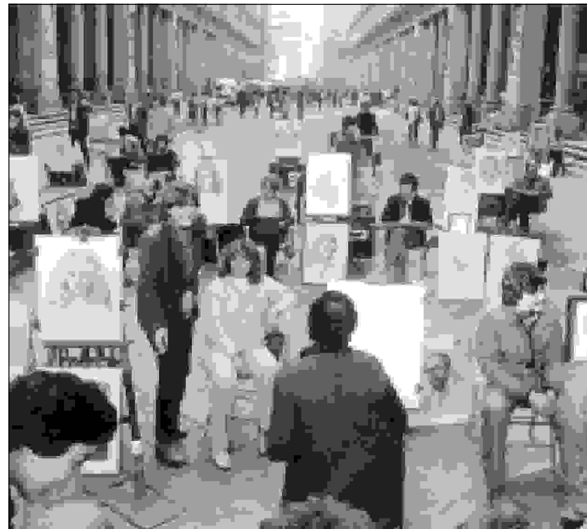
Straßensitzung statt Straßensatzung: Porträtmaler in Florenz

Die GRÜNE Fraktion stellt den Antrag, dass die Stadt Wuppertal die Projektgruppe "Spurensuche - Zwangsarbeit