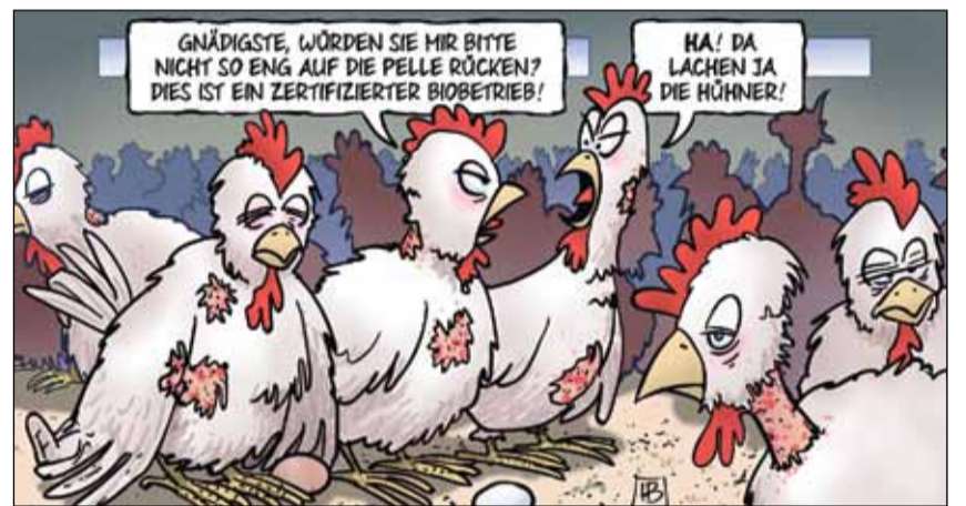
Cartoon: Harm Bengen

So können die Energiekosten für die Warmwasserbereitung um bis zu 10% gesenkt werden.