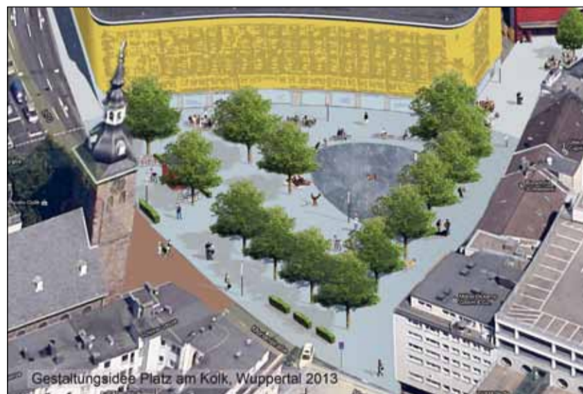
Gestaltungsidee Platz am Kolk, Wuppertal 2013

auch gespannt auf die Beteiligung der Bürgerinnen und Bürger, die mit Workshops bzw. Veranstaltungen eingebunden werden sollen. Bei der Nach-